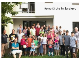
Roma-Kirche in Sarajevo