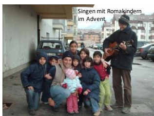
Singen mit Romakindern im Advent